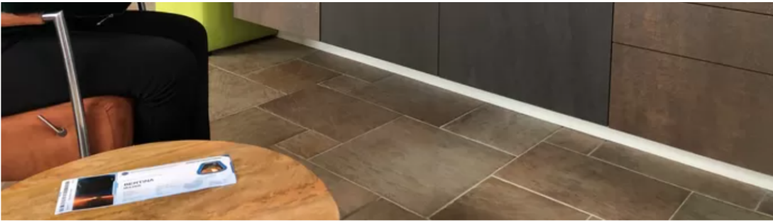
▲ Bertina Mulder uit Epe kijkt de landing van InSight op Mars.